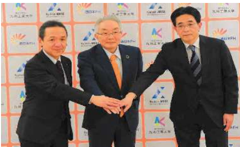
西日本フィナンシャルホールディングス ・九州工業大学・Kyutech ARISE