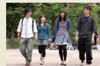
キャンパスのひとコマ

希望する企業へ学校推薦で入社試 験を受けた場合、1学生あたり1.4社 で内定を得ています。 (平成27年3月就職者実績)