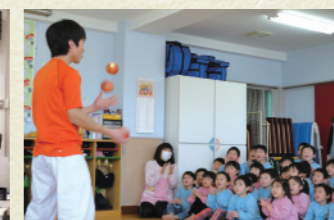
部活・サークル活動