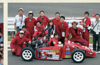
技術系競技会出場などの学生活動