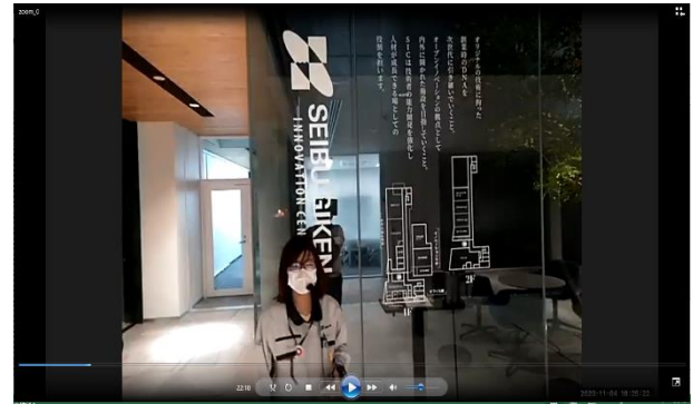
(株)西部技研 イノベーションセンター中継

九州工業大学と碧樹会は、学生のキャリア支援に係る相互協力を目的として、2019年7月10日に、包括連携に関する協定書を締結しております。詳細は、同日のプレスリリースをご参照ください