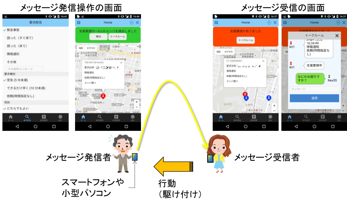
図 3 開発したアプリケーション