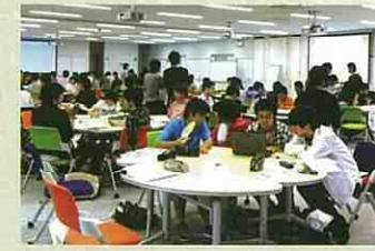
キャンパスのひとコマ

希望する企業へ学校推薦で入社試験 を受けた場合、1学生あたり1.16社 で内定を得ています。