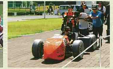
技術系競技会出場などの学生活動