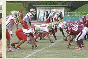
部活・サークル活動